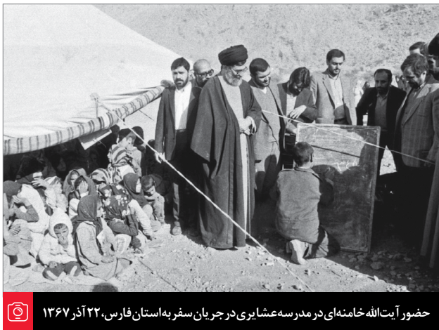
حضور آیت‌الله خامنه‌ای در مدرسه‌های پروری در جریان سفر به استان فارس، ۲۲ آذر ۱۳۶۷

آن وقتی که امام در سال ۵۸ در بیمارستان بستری بودند، همان جا جلوی بیمارستان جایگاه درست کردند و دسته‌هایی از ارتش آمدند آنجا رژه رفتند و روز ارتش به وسیله‌ی امام اعلام شد. ۹۱/۲/۳ یکی از بهترین و هوشمندانه‌ترین کارهای بزرگ امام عزیزمان، تعیین روز ارتش بود... امام برای اینکه هرگونه توطئه‌ای را در مورد نیروهای مسلح و ارتش جمهوری اسلامی خنثی بکنند، روز ارتش را معین کرد؛ یعنی من همین ارتش را، با همین خصوصیاتش قبول دارم و نظام اسلامی [هم] قبول دارد. حالا بنده که ده‌ها جلسه در خصوصیات ارتش با امام (رضوان‌الله‌علیه) صحبت خصوصی کرده بودم - یا دو به دو یا با حضور بعضی دیگر - می‌دانم این فکر قلبی و عمیق امام بود که باید ارتش را حمایت و تقویت کرد که انصافاً فکر درستی بود. ● ۹۶/۱/۳۰